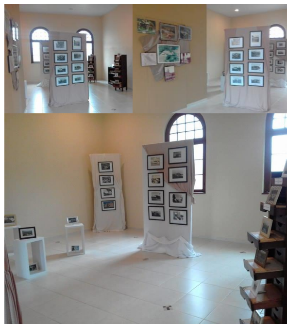
Exposição “Seminário de Corupá: O ontem e hoje da Paisagem Cultural”.

Exposição fotográfica: “Seminário de Corupá: O ontem e hoje da Paisagem Cultural”, com uma linha temática e temporal demonstra a ligação da comunidade que aqui viveu e suas culturas, evidencia principalmente as modificações das paisagens diante das necessidades que foram instauradas e introduzidas. A exposição já recebeu número considerável de visitantes e continuará aberta ao público até 31 de julho.