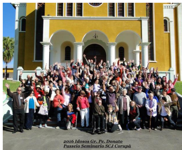
Grupo “Padre Donato” em visita ao Museu e Seminário.

Foi em uma destas visitas, através de um relato descritivo, que pudemos acrescentar à ficha técnica dos animais taxidermizados, informações importantes sobre as anomalias genéticas que fazem parte da coleção zoológica.