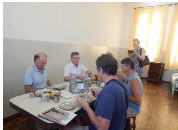
Ex-seminaristas visitando a ambientação.

Que este seja o primeiro de muitos encontros onde os seminaristas trazem e expressam suas vivências!