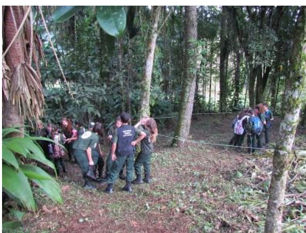
Alunos da PMA durante a prática no Paraíso do Irmão Luiz

Ao final, a atividade prática foi o momento de maior troca: os protetores reunidos em grupos tiveram que encontrar na trilha “pegadas” de mamíferos e discorrer na ficha técnica, sobre as características da espécie (tal ficha foi elaborada para esta dinâmica e assemelha-se a ficha utilizada na coleção zoológica) e sua aplicação teve o objetivo de atrelar a prática de campo ao conhecimento técnico empregado ao museu.