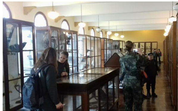
Alunos da PMA conferindo a exposição de taxidermia

taxidermia, onde puderam conferir qual animal era respectivo a sua “pegada” encontrada na trilha. Para o contentamento de todos os participantes, a maioria acertou ou chegou muito perto em sua classificação.