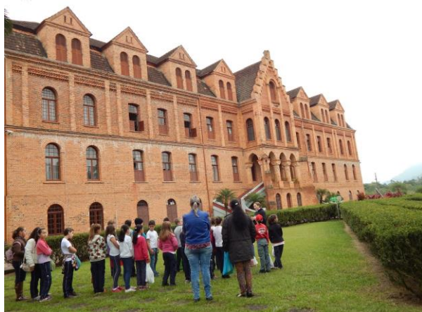
Alunos durante a visita no espaço externo

Os alunos estavam aprendendo sobre a história do município de Corupá e neste contexto foi apresentada a história do Seminário Sagrado Coração de Jesus. As professoras acreditaram que seria um aprendizado diferenciado se os alunos fossem conhecer pessoalmente o local. Foi contatada a equipe do museu que elaborou uma proposta de visita centrada na historicidade do espaço.