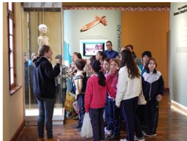
Visitando a exposição histórica do museu

Como falávamos da história do Seminário, não poderíamos esquecer o Museu, que está diretamente ligado à história da instituição e de quem aqui viveu, então, para finalizar, os alunos visitaram a exposição histórica, que ilustrou o que já vinha sendo apresentado aos alunos, e a exposição de taxidermia que retrata a própria história do Museu e seu fundador. A visita no Museu foi um dos momentos mais esperados pelos alunos.